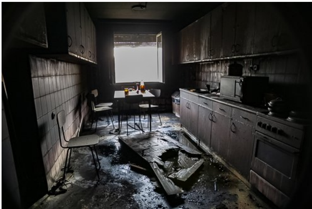
A rádays diákok

mindegyike kapott új szálláshelyet – a többi közt – a Nemzeti Közszolgálati Egyetem, az ELTE, a Szent István Egyetem, a Forestay által tulajdonolt MILESTONE kollégium, a Corvinus Egyetem és a Budapesti Gazdasági Egyetem kollégiumai fogadták be a diákokat.