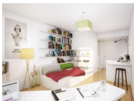
látványterv - Milestone kollégium, Budapest

Az épület a diákok minden igényét kielégíti, így a szobák mellett közösségi tereket, úgy mint lobbyt, tanulószobákat, edzőteremet, TV szobákat, tetőteraszt, kávézót és éttermet kínál. A lakóegységek többféle alaprajzi elosztásban is elérhetőek: mindegyikben található saját fürdőszoba és minikonyha, de vannak erkélyes/teraszos, nagy, galériázott belmagasságú, illetve bővített konyhával és közös térrel kiegészülő, összekapcsolt kislakások is. A szobák méretét a belsőépítészeti kialakítás maximálisan kihasználja és apró trükkökkel növeli a teret: például a fürdőszobák falai átlósan helyezkednek el, ami a szobákba lépve táguló tér érzetét kelti, illetve a bútorok is a legpraktikusabb, kompakt módon lettek kialakítva - miközben az esztétikai minőségről sem mondtak le a tervezők.