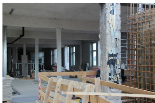
a graffitik már nem sokáig maradnak - Milestone kollégium, Budapest - fotó: Varga Csilla

A MILESTONE Budapest egy felső kategóriás kollégium, mely magas minőségű szállást kínál magyar és külföldi diákok számára. A Forestay Development fejlesztésében Magyarországon elsőként valósul meg privát alapon működő, kollégiumi céllal épülő, nagyméretű beruházás, mely 418 egyszemélyes szobát és 1300 m 2 kiskereskedelmi területet foglal magába. Az ingatlan a Semmelweis Egyetem EOK épületének szomszédjaként, a Klinikák metró megállótól 80 méterre, tökéletes lokációval kínál közösségi szálláshelyet.