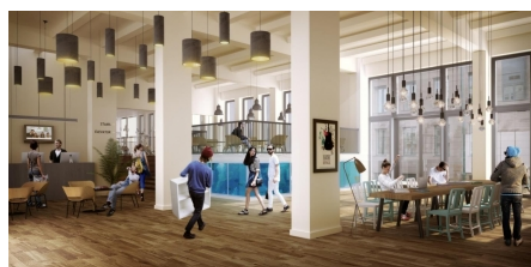
látványterv - Milestone kollégium, Budapest

A Milestone Budapest diákszallás egyrészt egy modern, innovatív, egyedi szolgáltatásokat nyújtó beruházás, másrészt kiemelt értékteremtő szereppel bír a IX. kerület szívében. A fejlesztés a 1950-es években épült Labor Műszeripari Művek épületének és közvetlen környezetének rehabilitációját tűzte ki célul. Az üzemeépület 1991-ben zárta be kapuit és a tűzoltóság szertárai kerültek át ideiglenesen a területre. A romos, elhagyott épület 2005-ben a Tűzraktár kulturális központ helyszínévént működött - fiatal művészek, színészek és építészek számára kínált bemutató- és gyakorlási lehetőséget. A hely múltja nem tűnik el nyom nélkül - a Tűzraktár graffitijeit a bontás előtt befotózták és a tervek szerint a közösségi terek enteriőrjében valamilyen formában vissza fognak köszönni. A pince + 4 szintes épület, a Tűzraktár ideiglenes hasznosítását leszámítva, mintegy 25 éven keresztül használaton kívül állt, a kollégiumi beruházásnak köszönhetően most megújul, valamint egy „L” alakú épületszárnyal bővül földszint + 6 emeletes magasan. Az átalakítás és a bővítés terveit az Avantgard Építész Stúdió és a K-arc Kreatív Műhely készítette, a belsőépítészterít pedig a Gangoly&Krisztiner Architekten volt felelős. A két épületrész illesztése a szintszámok eltérése miatt érdekes eltolódásokat, izgalmas szintkezelést eredményezett (például a konditerem esetében).