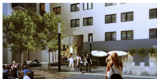
látványterv - Milestone kollégium, Budapest

A diákszallás földszintjén áthaladó az 1 300 m 2 -es közforgalmú sétány és park közvetlen összeköttetést kínál az egyetemi épület és a metrómegálló között. A kollégium mellett áll a SOTE elméleti tömbje és a környéken több további egyetemi épület is található - ezeket eddig a keskeny Thaly Kálmán utcán közelítette meg a diáktömeg. A kollégium tervezésénél tudatosan törekedtek arra, hogy egy új útvonalopció is létrejöhessen az erre közlekedők számára, így alakult ki a passzázsos elrendezés. A környéken kevés pihenésre, üldögélésre alkalmas köztér található, így a belső udvarral ezeket a lehetőségek is bővülnek - a park mellett az épületben kertkapcsolatos kávézók és éttermek kínálnak a kollégium lakóinak és a környéken megfordulóknak kikapcsolódási lehetőséget. A közeljövőben a belső kert övező többi épület is átalakuláson megy keresztül a harmonikus látvány érdekében.